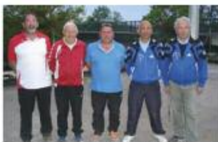
Départemental double 2016