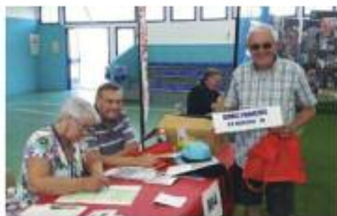
Championnat de France 2016 à Béziers