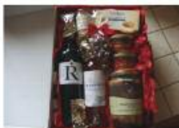
50 colis distribués en 2016