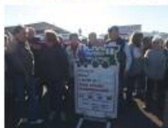
St Jean de Luz