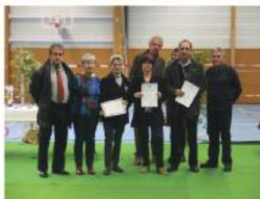
OMS Le Blanc – Février 2016