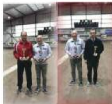
Départemental simple 2016